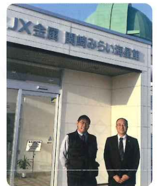
関崎みらい海星館

改修のために一時休館していた海星館が、「関崎みらい海星館」と通称も変更され7/21にリニューアルオープン。新設されたプラネタリウムを体験。素敵な星空の世界を体験することができました。投影スケジュールもHPにアップされていますので、みなさんもぜひ体験されてください。天体望遠鏡や館内展示も新しく、工夫もたくさん。アサギマダラの飛来のために周辺を整備中ですから、今後も楽しみです。「リニューアルは新たなスタートの一步」とのこと、これからの充実した整備と運営を今後とも後方支援していきます。