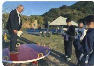
インクルーシブ遊具

障がいの有無にかかわらず、みんなが楽しく、一緒に遊べる遊具の体験会場を10/30(月)に独自調査。実は縁あって「高校生の居場所づくり」をしている団体の公園プロジェクトに関わっている高校生や大学生と一緒に体験(写真左)。後日、体育器具会社の方々との意見交流にもつなげることができました(写真右)。