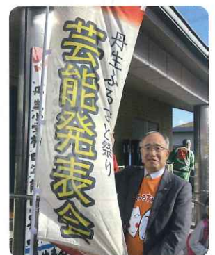
丹生ふるさと祭りにて

あいさつ行動(*^_^*) 「7」のつく日を中心に 判田校区3カ所& 丹生校区で継続中 「STOP地球温暖化」や 「NOおいたミサイル」 等のプラカードを持って!