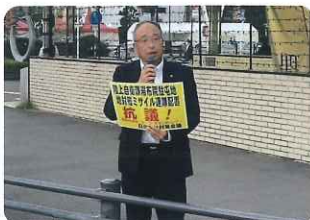
街頭にて「大型弾薬庫新設に反対」等を訴える

これからもあらゆる機会に訴えます。市民運動の仲間みなさんや平和運動団体等の方々とも連帯していきます。そのつなぎ役としてもねばり強く活動していきたいです。