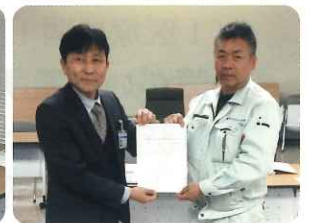
要請内容を手渡す