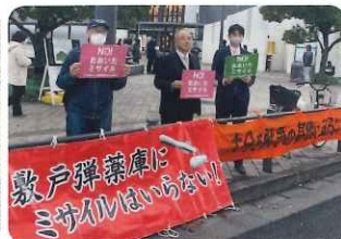
市民運動の仲間とスタンディング