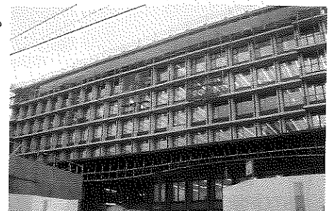
建設中の荷揚複合公共施設

荷揚町小学校跡地に建設中の複合公共施設が来年度から供用されることから、この施設に関する条例が制定されました。