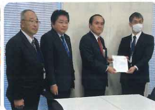
防衛省への緊急要請行動に同行(東京)