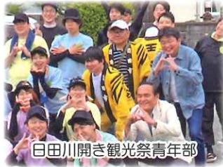
白田川開き観光祭青年部