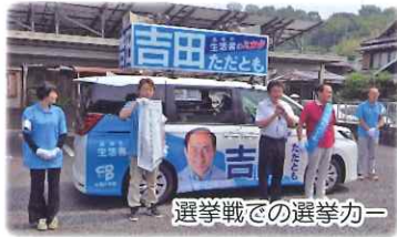
選挙戦での選挙カー