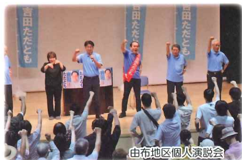
由布地区個人演説会