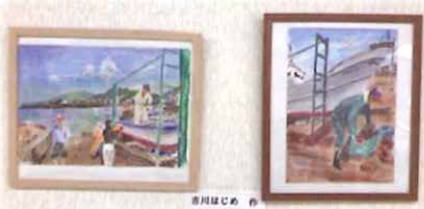
吉川はじめのスケッチ